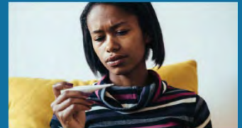
Viêm họng kèm sốt